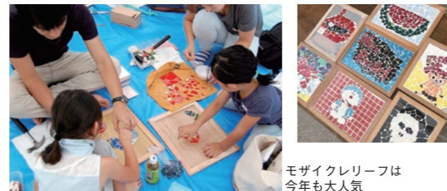
モザイクレリーフは今年も人気

小物を親子で楽しみながら作業しました。カラータイルを使ったモザイクレリーフは、低学年から高学年まで幅広く楽しめる工作で、今年も大人気でした。下書きした上に色とりどりのタイルをのせて仕上げしていく作業に、暑さも忘れて親子で夢中になっていました。