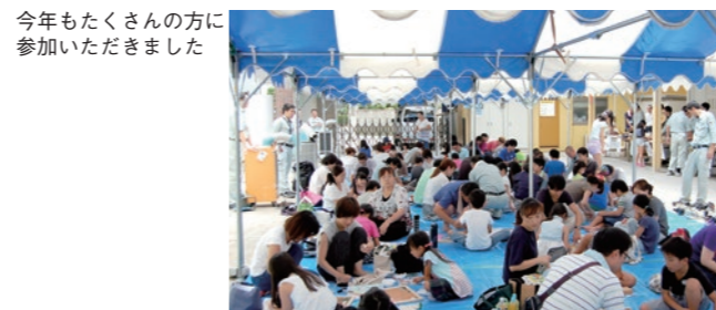
今年もたくさんの方に参加いただきました