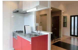
ショールーム形式のリフォームスタジオ

この度ジェクトでは、中原工房に隣接して「J E C T O リフォーム&プランニング・スタジオ」をオープンさせました。各種建築資材のサンプルを取り揃えたショールームや、プランニングの打ち合わせを行うスペースと、新たなリニューアルの営業推進のオフィスも兼ねております。