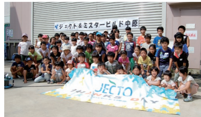
ジェクト社員もお子様方の笑顔から元気をいただきました!

今年も手軽に作れる扇子、ペン立て、コースター、考えながら作るビー玉迷路、ペンケース、ティッシュボックス、工夫して作るスチロール工作、サッカー盤など、難易度の異なる工作を用意しました。参加した皆さんは希望の工作を選び、建築材料を使って、遊べるおもちゃや実際に使える