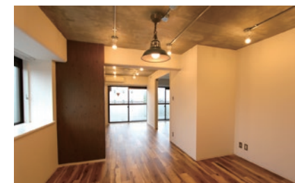
2LDKを1LDKにしたリノベーション物件「メイプルハウス301号室」と間取り図

メイプルハウス 301号室は、2LDKを1LDKにしたリノベーション物件。壁をなくすことでスペースを広く見せたLDKには、木目やレンガ調のタイル(壁)、コンクリート(天井)を使って、新しいアメリカンヴィンテージテイストの空間を表現 (FOLD AMERICAN LIFE)。