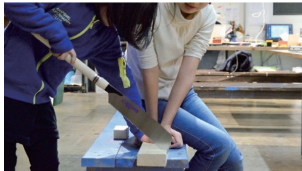
道具を使った体験

川崎市が推進する「川崎市Wood - Education 推進事業」は、国産木材の利用促進の一環として、木に対する理解を深める「木育」事業や、木工技術を普及させるための技術講座など、国産木材利用に関する幅広い人材育成のためのプロジェクトです。その一環として、ジェクトは(株)内田洋行との協力体制のもと、2017年11月14日に「こどものための技術講座「UDEMAE (ウデマエ)」を