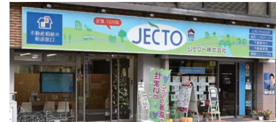
不動産部仲介営業課・中原店と業務管理課の入口に設置された「ジェクト看板」

ジェクトらしさがより一層増した店頭の前には、立ち止まってご覧になるお客様やオーナー様の姿もありました。本年も皆様の期待に応えられる企業へと日々進化し続けていけるよう従業員一丸となって頑張ります。