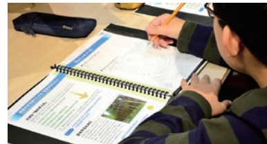
教材の「ちよこっとノート」に作りたいものをデザイン

開校、12月3日にワークショップ「木の香りのするクリスマスツリーづくり」を開催しました。