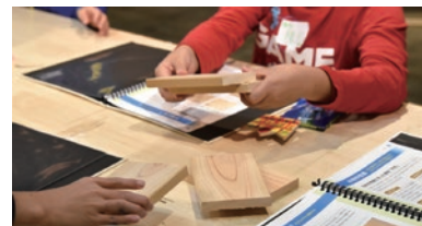
木材に触れながら基本知識を学びます

川崎市が推進する「川崎市Wood - Education 推進事業」は、国産木材の利用促進の一環として、木に対する理解を深める「木育」事業や、木工技術を普及させるための技術講座など、国産木材利用に関する幅広い人材育成のためのプロジェクトです。その一環として、ジェクトは(株)内田洋行との協力体制のもと、2017年11月14日に「こどものための技術講座「UDEMAE (ウデマエ)」を