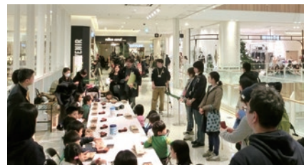
グランツリー武蔵小杉で開催された「木の香りするクリスマスツリーづくり」の様子

「UDEMAE (ウデマエ)」は、長年ワークショップを開催してきた中原工房が「成長過程でものづくり体験をさせたい」という保護者の方の強い要望を反映し実現しました。各カリキュラムは4カ月単位(第1期募集は終了)、木材の基本知識から実技を中心にデザインまで学ぶことができます。中原工房のスタッフが安全で安心な学習環境を作り、ものづくりを通じ