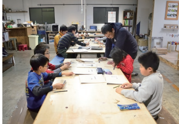
中原工房で行われた「UDEMAE (ウデマエ)」に参加した子どもたち