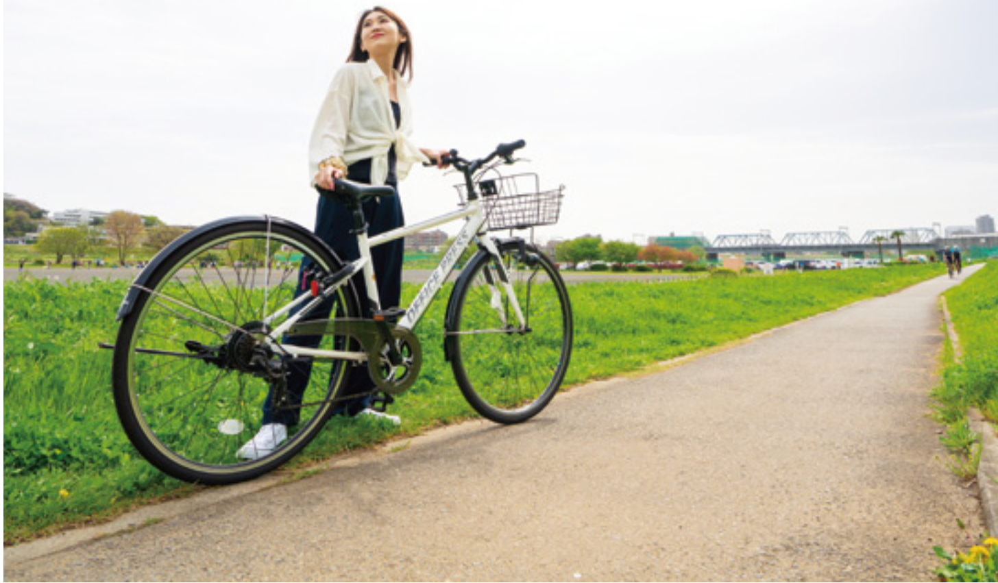
【多摩川サイクリングロード】多摩川サイクリングロードは通称。自治体が定めた正式名称は「たまりパー50キロ」