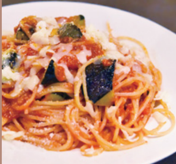
「アンチョビ・揚げナス・モッツァレラのシチリアーナ」

あっという間の楽しい時間は過ぎ、お会計時に「また来ます」が自然と口からこぼれた。仕事帰りにパスタのご褒美。今日も幸せな気分で家路に着く。