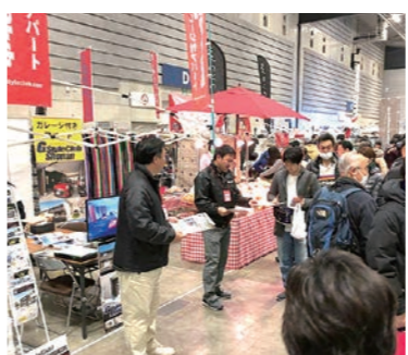
ブースでは、約2,400枚ものチラシを配布しました

2月23日、24日の2日間、パシフィコ横浜で開催されたクラシックモーターショー「ノスタルジック2デイズ」に瀬戸建設様(G-styleclub 湘南)と共同出展しました。会場では、横浜や川崎の物件についての質問も多く聞かれ、関心の高さを実感しました。賃貸ガレージハウスは、1階がガレージ、2階が居住スペースという趣味を楽しむコンセプト賃貸です。天候・時間に左右されず愛車のメンテナンスができるのも魅力の一つ。他の物件との差別化を図ることで、入居期間の向上を見込めます。