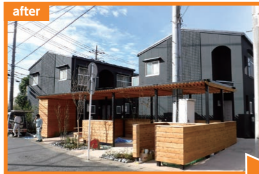
Flat空 (川崎市麻生区百合ヶ丘)

ワクして毎日が楽しくなる生活ができる魅力ある物件に生まれ変わりました。このご評価をいただいております。