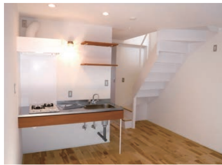
一部の部屋で内装を大幅に変更。キッチンには従来の開閉式の扉をなくし、自由度の高いキッチンスペースとなりました (Flat空)

ワクして毎日が楽しくなる生活ができる魅力ある物件に生まれ変わりました。このご評価をいただいております。