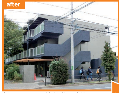
宮前アパートメント (東京都杉並区宮前)