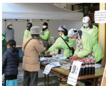
地元商品の販売&試飲