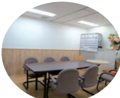
オフィスの応接室は腰壁、床などに無垢材が使用されています

川崎住宅は「良質な賃貸不動産の提供により、お客様の生活とビジネスをサポートする」を会社の使命に掲げ、賃貸管理事業を中心に関連事業を展開しています。簀口社長が考える良質な賃貸住宅についてお聞きしました。「遮音性、耐震性を備えることは基本です。当社は特に中古賃貸物件を取得する際は十分な耐震調査をし、水準に達していない場合は耐震補強工事を行います。また、接着剤などに使用される化学物質をなるべく減らすために自然素材を取り入れています。法令基準を順守しながら、腰壁までは無垢材を使用する、壁は漆喰や紙質、布質のクロスを使うなど、最大限の対応をしています」