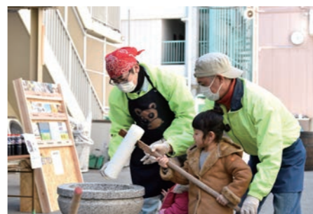
餅つき体験の様子