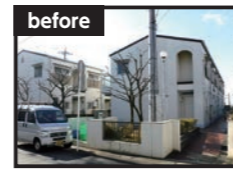
Esपोワール百合ヶ丘 (旧名称) 時の外観