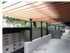
木調ルーバーのデザインが周囲の環境と調和しています