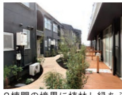
2棟間の境界に植林し緑あふれる庭として生まれ変わりました