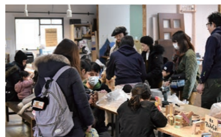
木の工作や手づくりのおもちゃで遊ぶ子どもたち