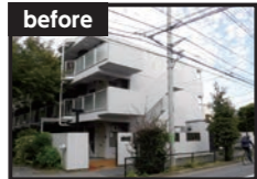
Esपोワール杉並 (旧名称) 時の外観

小田急バス(株)様が所有する2つの賃貸マンションの大規模リノベーションが、(株)ブルースタジオ様設計、ジェクト施工でこのほど完成しました。いずれも築30年以上が経過しており、リフォームが必要な時期にきていました。そこで小田急バス様の「住民に愛され、長く住んでも切ったリノベーション計画がスタートしました。」 都心とは思えない自然に囲まれた環境に建つ「宮前アパートメント」(旧Esपोワール杉並)は、間取りを2DKから1LDKに変更し、床には無垢材を使用。部屋は明るく開放的で自然と光を感じる空間となっ