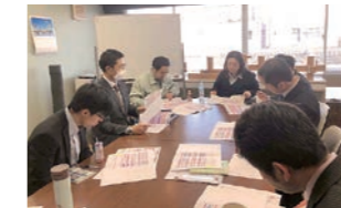
午前中の空室会議の様子