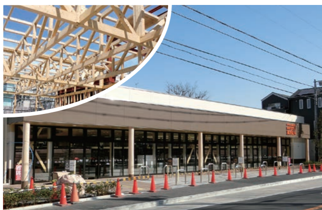
そうてつローゼン塚越店の外観。写真左上は無垢のヒノキや杉を使用した躯体

「店舗部分の構造躯体には無垢のヒノキや杉を使用し、外部意匠には無垢の丸太材など木材を多用。また、内装の一部にも国産木材を使って温かみのあるデザインになっています。こだわりの木材と特殊な工法により、長い年数に耐え得る建物をつくることができました。外壁も