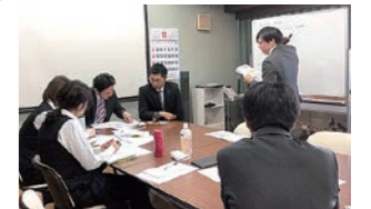
リフォーム担当からお部屋の特徴を共有しています