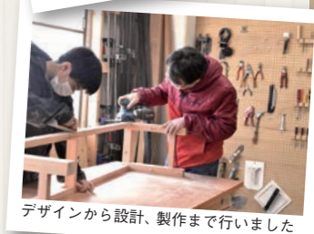
デザインから設計、製作まで行いました