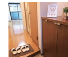
エントランスの見せ方には特に気を配っています

午後からは空室巡回を開催！長期空室物件を中心にスタッフ皆でお部屋の掃除や飾りつけをしながら、お部屋の問題点を見つけて改善したり、良い点をつけて皆で共有したりしています。12月には42室あった長期空室のお部屋も9部屋(2月末時点)まで減少しました！