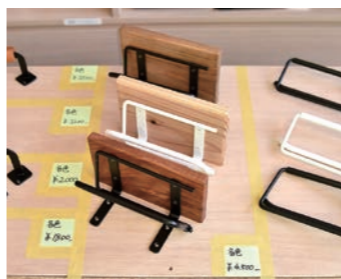
中原工房スタッフが作ったアイアン雑貨も販売