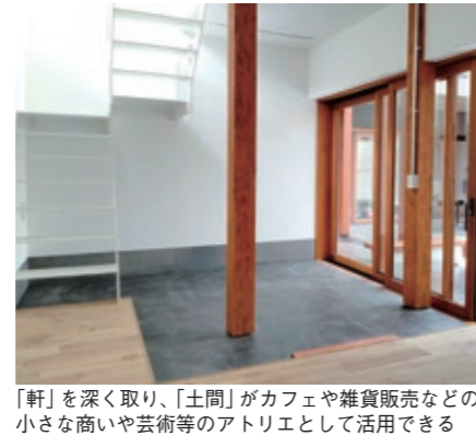
「軒」を深く取り、「土間」がカフェや雑貨販売などの小さな商いや芸術等のアトリエとして活用できる

ジェクトが施工を担当した複合施設「hocco」が完成しました。小田急バス様が沿線地域活性化を目的に、バス折返場を地域コミュニケーション