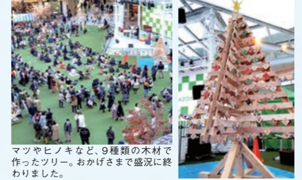
マツやヒノキなど、9種類の木材で作ったツリー。おかげさまで盛況に終わりました。

12月11日(土)に「川崎駅前 優しい木のひろば」が開催され、ジェクトは全国より提供いただいた国産木材を使った約3mのクリスマスツリーの制作デモンストレーションを行いました。制作過程を披露しながら、技術や道具、樹木の種類などを紹介。ツリーに付けるオーナメント作りの木工ワークショップも開催し、完成後は飾り付けを行いました。