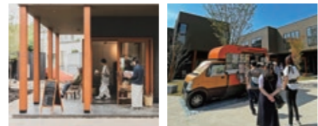
共用スペースを開放することで、イベントなど入居者や近隣住民のコミュニケーションの場にも

ンおよび交通のハブとして開発。設計は、「住まいと暮らしをデザイン」する取り組みで数々の受賞歴を誇るブルースタジオ様が担当しました。今回、小田急バス様の田急バス様の地域住民のつながる場所にしたいたいという思いから、地域密着のビジネスモデルを実践しているジェクトが選定されました。小田急バス様×ブルースタジオ様と、ジェクトの取り組みは今回で3件目。