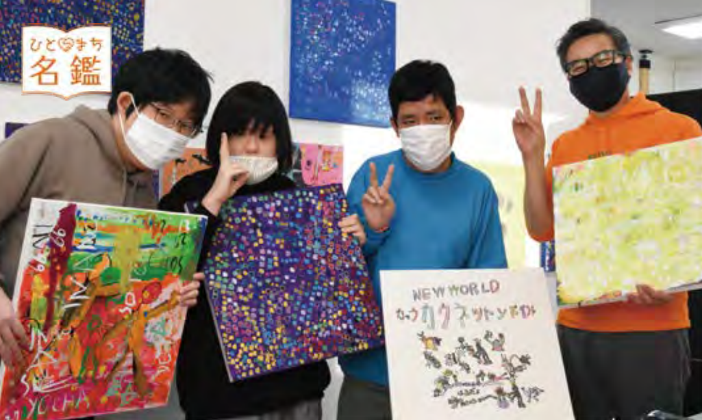
自身の作品を持ったアーティスト達と大平さん(一番右)。