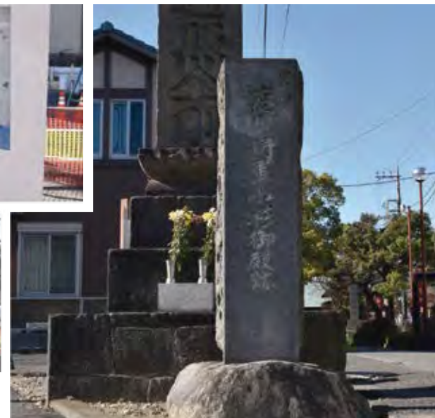
右:西明寺の門前にある石碑。 左上:「小杉御殿見取絵図」の看板。 左下:カギ道は今も生活道で使われる。