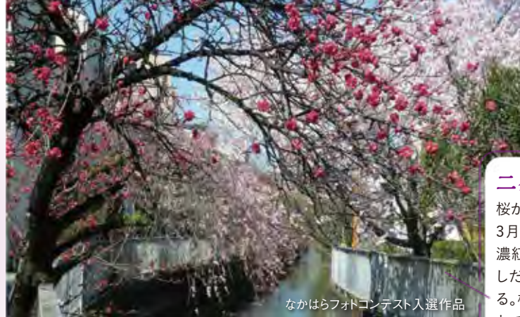
なかはらフォトコンテスト入選作品