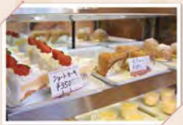
取材時の冬は、苺やバタークリームが、 春は桜のスフレロールがお目見え。

見た目はシンプルに。でも、素材ひとつひとつを大切に。 目新しいものに目が行きがちですが、 立ち戻って、やっぱりこの味。 「ただいま」と迎えてくれる、地元のおやつです。