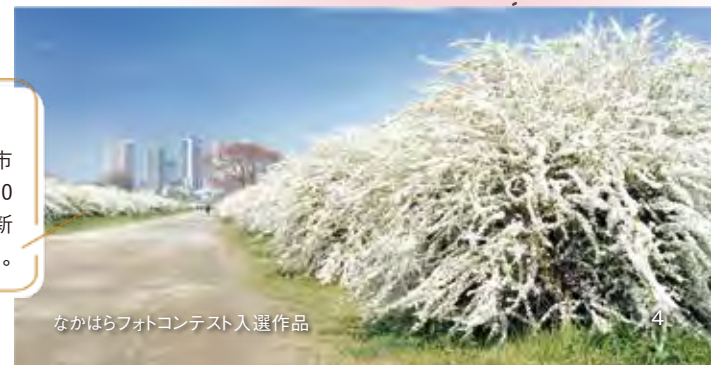
なかはらフォトコンテスト入選作品

高津区久地2丁目地先~幸区古市場地先の、多摩川右岸に約2,700株の白い花が咲き誇る。小杉~新丸子間は桜との競演が楽しめる。