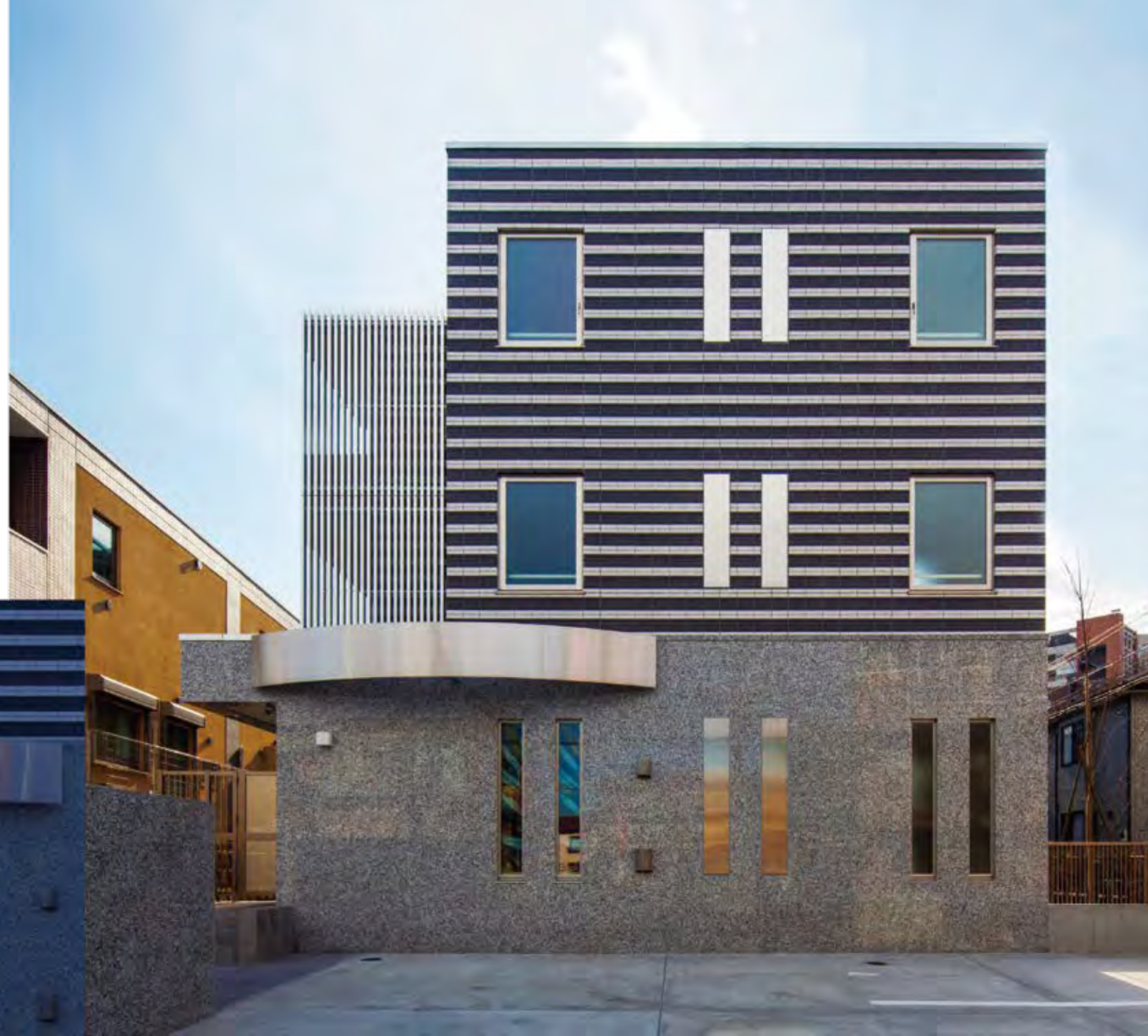
クレスト井田 中原区井田 2022年1月竣工

朝日に浮かぶ 重厚なシルエット 夜を灯す やさしいスタンドグラス 上質でモダンな暮らしがはじまる