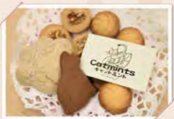
サクサクとした食感の焼き菓子たち。 店名にちなんだ「猫」モチーフも。