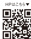
HPはこちら▼ アフターコロナでは、当スタジオのギャラリーを街にひらく予定。