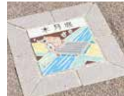
上: 原家の屋敷へ続く暗渠。 左: 足元のタイルが目印。