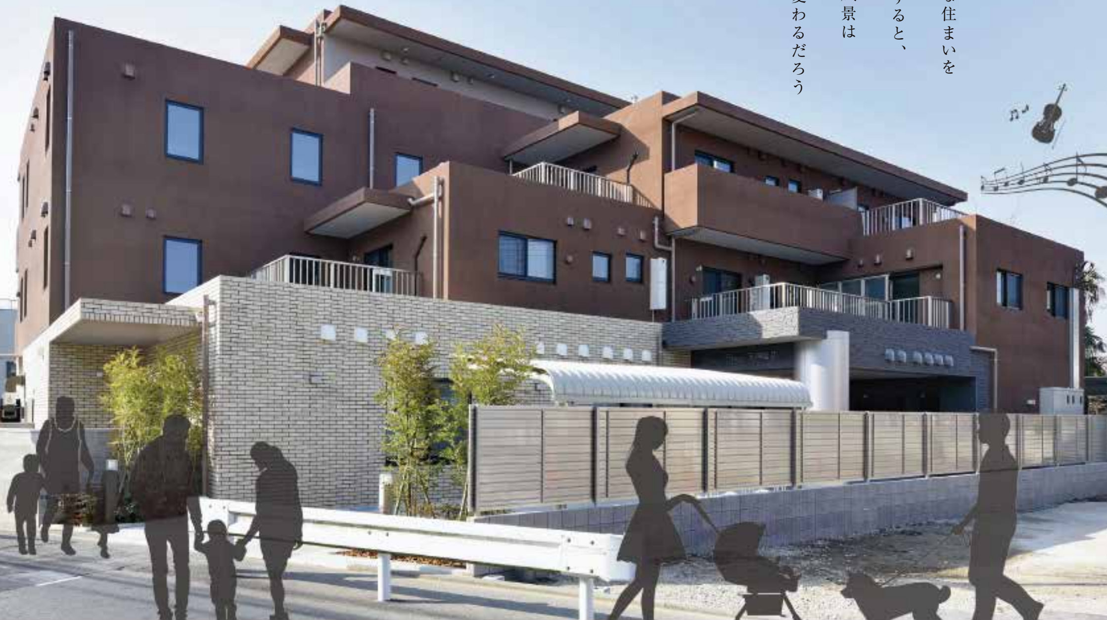
楽器可、ペット可の賃貸マンション 「サウンドステージ天神前2」 中原区上新城 2022年3月竣工