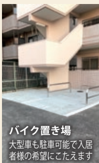
バイク置き場 大型車も駐車可能で入居者様の希望にこたえます

お部屋探しの方のニーズに合わせた設備を追加。昨今需要の高まる防犯カメラなどを設置し、建物全体のグレードアップをはかりました。