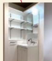
収納力アップ! 上部に枕棚