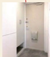
汚れた物も置きやすい靴箱下収納