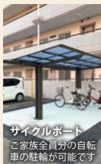
サイクルポート ご家族全員分の自転車の駐輪が可能です