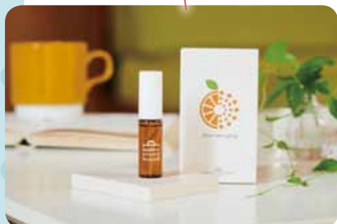
アロマプレー。パッケージをリニューアルし、ギフトにも◎