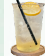
レモネードソーダ

店内ではシェア棚での委託販売やワークショップの開催もあり、訪れるたびに新しい出会いや発見があるのもこの場所ならではの。住宅地の静けさに包まれながら、人と人がゆるやかにつながるひとときを過ごせます。