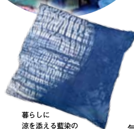
暮らしに 涼を添える藍染の クッションカバー