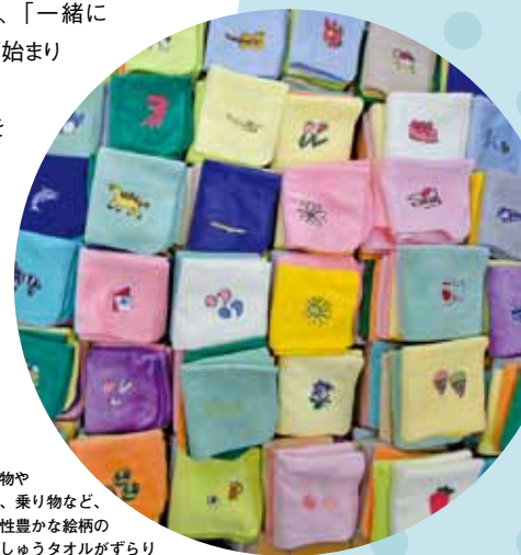
動物や 花、乗り物など、 個性豊かな絵柄の 刺しゅうタオルがずらり