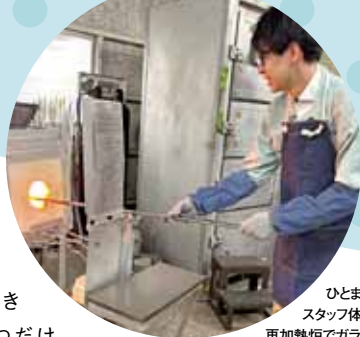
ひとまち スタッフ体験中。 再加熱炉でガラスを 熱しているところ

自分でつくったグラスにキンキンに冷えた飲み物を注ぎ、夏を涼やかに過ごすのはいかがですか？彩グラススタジオでは、吹きガラス体験を通して世界に一つだけのグラスづくりが楽しめます。ひとまちスタッフも実際に体験してみました。サンプルを参考に好みの形や色、模様をつけ方を選ぶところからスタート。一から丁寧に教えていただき、制作中もマンツーマンでサポートしていただけるので、安心して楽しむことができました。吹きガラス体験は小学生から参加でき、夏休みの思い出づくりにおすすめです。