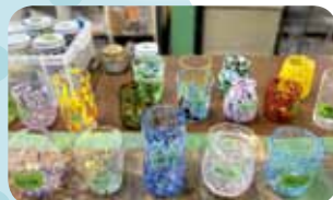
グラスサンプル。好きな形や色合いを選べます