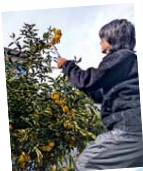
アロマに使う高津区産ユズを収穫

男性や子ども、老若男女問わず好まれます。枕やハンカチ、マスクにひと吹きして、夏の涼を感じるひとときに取り入れてみては？